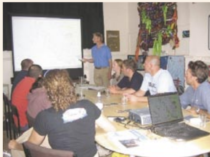
Swit TGC Global Connections yn cael ei defnyddio gan gr p cymunedol